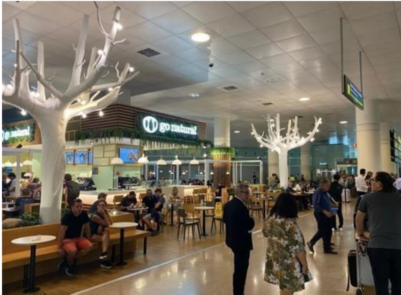
Фото місця зустрічі (1-й термінал аеропорту Барселони): ТРАНСФЕРИВ АЕРОПОРТАХ КАНАРСЬКИХ ОСТРОВІВ

Після прибуття та після того, як ви забрали свій багаж, будь ласка, підійдіть безпосередньо до стійки трансферної компанії « CANARY SHUTTLE » у зоні прибуття.